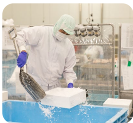
一貫した生産体制で 確かな商品を届ける

食品を扱ってきた経験を活かそうと、株式会社さんれいフーズに入社しました。現在は、グループ会社のさんれい製造境港工場に出向し、地元で水揚げされたベニズワイガニの加工など、生産工程管理と出荷を担当しています。まだ入社間もないですが、周囲の人から必要とされた時にやりがいを感じます。今後は、知識を増やしてみんなから慕われる存在になりたいです。また、さんれいフーズは海外との取引も盛んなので、海外生活で培った語学力も仕事で役立てていきたいですね。