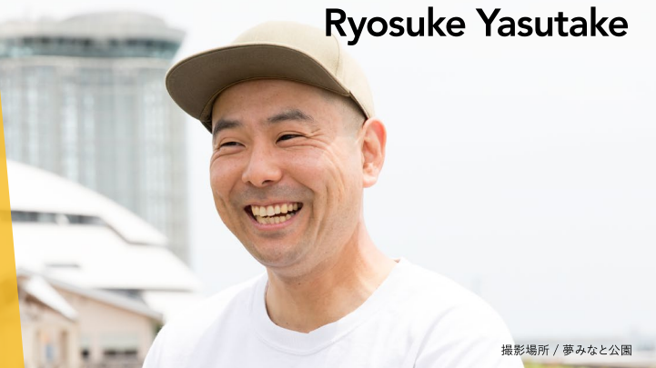
撮影場所 / 夢みなと公園

熊本県熊本市出身。地元の高校を卒業後、アメリカに留学。旅行代理店のハワイ支店やイギリスに本社のある警備会社の南アフリカ支局で働いた後、2009年にハワイ時代の先輩と共同経営でドイツに手打ちそばレストランをオープン。2016年5月に鳥取県へIターンし、同6月にさんれいフーズに入社。米子市で妻と2人暮らし。