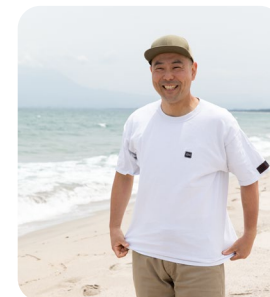
オフには海を眺めてのんびり

実は鳥取県にはIターンするまで来たことはなく、帰国して初めて鳥取県を訪れましたが、本当に住みやすくていいところだと感じています。渋滞もないし、人混みもないし、ちょうどいい町のサイズ。今では実家のある熊本市でさえ都会のように思えて、熊本から鳥取に帰ってくるとほっとするくらいです。妻も「魚がおいしくて海も近い」と気に入っています。休日には妻と近くの海や山へ行って自然を満喫しています。鳥取に来て、幸運にも素晴らしい人たちに恵まれて、会社の皆さんにもよくしていただいていますし、近所の皆さんにもとても親切にいただいています。子どもができたから、鳥取でのんびり子育てしたいです。