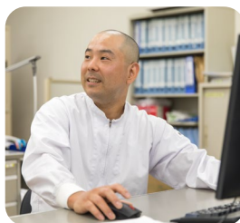
生産工程管理と出荷を担当

ドイツでそばレストランを経営していましたが、ドイツ人の妻は日本が大好きで、以前から「日本に行きたい」と言っていました。私も子育ては日本でしたいと思い、帰国を決意。でも、熊本県の実家は弟が継いでいるし、東京のような大都会で暮らせる自信もない。日本で再出発する場所を探していた時に、鳥取県に移住した人を紹介するテレビ番組を見て、ふるさと鳥取県定住機構に連絡したところ、仕事探しに関してとても丁寧に対応してもらい、鳥取に決めました。