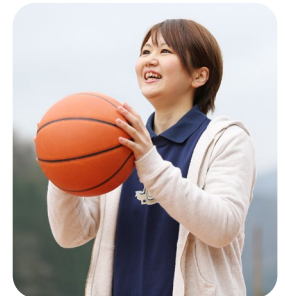
休日にはバスケで汗を流す

中学、高校とバスケットボール部に所属していて、今もたまに高校時代の部活仲間と集まってバスケットを楽しんでいます。以前は忙しくてほとんど休みが取れませんでした。今は希望すれば連休も取れるので、愛知県にもよく遊びに行っています。これから県内のいろいろなところに出掛けて、鳥取の良さをもっと発見していきたいです。