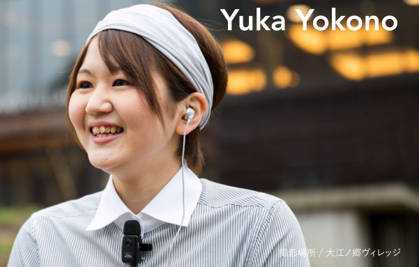
撮影場所 / 大江ノ郷ヴィレッジ

八頭町出身。鳥取県立鳥取西高校から愛知県の大学へ。卒業後、愛知県内で就職。2016年5月にUターンし、大江ノ郷自然牧場に入社。八頭町の実家で両親、兄弟と6人暮らし。高校時代、バスケットボール部に所属し、県大会2位の成績を収め、中国大会にも3回出場。