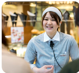
いつも笑顔で接客

愛知県の大学に進学して、そのまま就職しましたが、いずれは鳥取に帰ろうと思っていました。お菓子づくりが好きで、製菓に関わる仕事に就きたいと考えていたところ、ふるさと鳥取県定住機構に出ていた大江ノ郷自然牧場の求人情報を見て、実は募集が出ないかと待っていたので「今だ!」と思い、Uターンすることを決めました。大江ノ郷ヴィレッジがオープンした1カ月後の2016年5月からスタッフに加わりました。