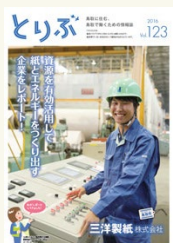
“さすが鳥取の企業” 地域に貢献し、全国・ 世界で活躍する企業が 鳥取にはあります。