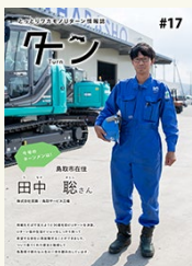
“やっぱり鳥取” 鳥取を選んだセンパイ たちの声を集めました。