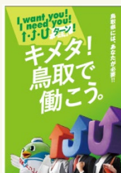
“鳥取にキメタ” 鳥取で働くことの魅力 をギュッとまるごと紹介 しています。