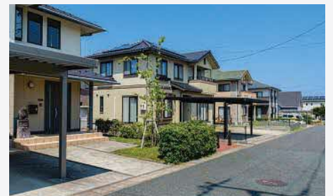
きらりタウン赤碕