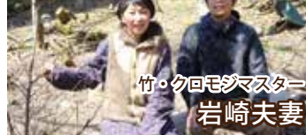
竹・クロモジマスター 岩崎夫妻