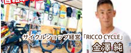
サイクルショップ経営「RICCO CYCLE」 金澤純