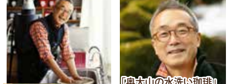
『奥大山の水洗い珈琲』 遠藤明宏