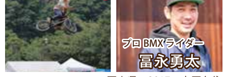
プロBMXライダー 富永勇太