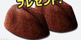
“白ウサギフィナンシェ プレミアムショコラ”