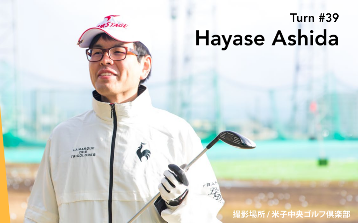
撮影場所 / 米子中央ゴルフ倶楽部

境港市出身。国立米子工業高等専門学校卒業後、兵庫県にある重工メーカーに就職し、社内システムエンジニア（SE）として11年勤務。2014年1月にUターンしてシンワ技研コンサルタント株式会社に入社。現在は境港市の実家で母と妻、子どもと4人暮らし。