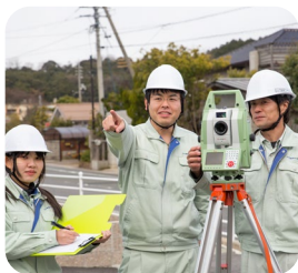
IT分野から各業務をサポート

以前は仕事内容によって部署が分かれていましたが、今はシステムの企画や開発、サーバなどの導入・更新、社員教育など、担当する範囲が広くなり、幅広いスキルを身につけることができました。また、建設コンサルタント業は資格が重要視されるので、入社後すぐに資格の勉強を始め、ITストラテジストや情報工学部門の技術士などの資格を取りました。現在は技術士の総合技術監理部門の資格取得に向けて励んでいます。私が企画したシステムで「仕事がしやすくなった」「助かった」と言ってもらえるとうれいですね。