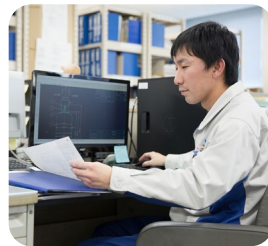
需要に合った製品を設計

岡山県で働いていた時、鳥取県に住む現在の彼女と知り会いました。結婚を考えた時、実家から遠い岡山県へ来てもらうことは彼女にとって負担が大きいと考え、自分が鳥取で再就職の方が結婚後の生活もスムーズに始められると思い、1ターンを決めました。前の会社での経験が活かせる職場で、各種高圧ガス容器などを製造販売する総合メーカーである神鋼機器工業(株)を転職先を選びました。