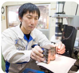
製品の品質を厳しくチェック

現在は、技術部で製品の設計や図面作成、製品の溶接部分をチェックして不具合が出ないようにする品質改善活動などを主に行っています。同じ製造業でも会社が違えば考え方や仕事の仕方は違う部分があり、転職したことで新たな発見や、それまでできなかったことができるようになって自分の経験値を上げることができました。職場の雰囲気も良く、楽しく働いています。今後は、与えられた仕事や課題をこなして、結果を出していきたいです。