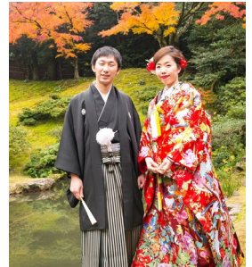
新生活に向けて準備中 (前撮写真)

晴れた日には東郷湖の周りを散歩して景色を楽しんでいます。鳥取の豊かな自然環境を活かして、もっと生活を充実させていきたいです。