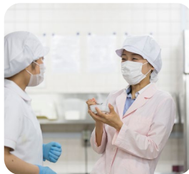
アットホームで働きやすい職場

両親が鳥取市出身で、幼い頃から毎年、鳥取の祖母の家を訪れていました。自然が豊かでのどかな環境が自分には合っていると思っています。両親からいずれは鳥取に戻ると聞いていたので、「鳥取で働きたい」という気持ちをずっと持っていました。祖母に会いに一人で鳥取を訪れた際、ふるさと鳥取県定住機構を訪ねたところ、タイミング良く現職の施設を紹介され、アットホームな雰囲気と、職員の皆さんの親切な対応に1ターンを決めました。