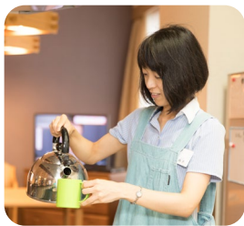
笑顔で楽しく食事を提供

現在は主に、どんな食事がご利用者様に喜ばれるか考えたり、食事量から健康面をチェックしたりしています。前職では食事がされる方と直接関わることはできませんでしたが、今は食べてくださる方々のそばで、「おいしい」と喜ぶ顔を見られるのがうれしいですね。ご高齢の方が食べやすいように食材を細かく刻んだり、ペースト状にしたりしていますが、盛り付け方や香りなどを工夫して、目や心でも楽しめる食事を提供していきたいです。